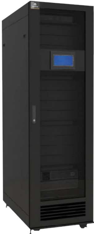
Micro data center Vertiv™ SmartCabinet™

O sistema também estabiliza tensões e frequências automaticamente, de forma que o equipamento de TI não tenha desgaste excessivo que reduza sua vida útil. Como resultado, ocorrências de indisponibilidades não previstas foram drasticamente reduzidas.