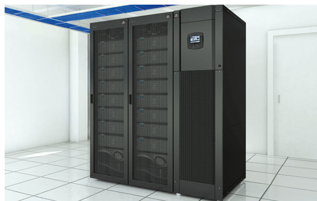
Liebert® CRV com aplicação em sala pequena