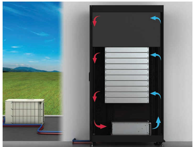
Vertiv™ VRC instalado em rack rejeitando calor para o plenum do teto